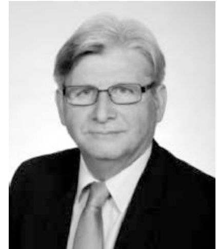
Dr. Szabó Tamás Jászberény polgármestere

Dr. Szabó Tamás polgármester Recsken született 1957-ben. 2010 óta áll Jászberény élén. Polgármesteri munkája elválaszthatatlan attól, hogy előzőleg kórházigazgatóként dolgozott. Mindkét hivatás és megbízatás a szolgálatról, mások segítségéről szól. Ahogy fogalmaz: polgármesterként ugyanúgy a gyógyítás a feladata, mint orvosként, még ha a mérték és a méret nem is ugyanaz.