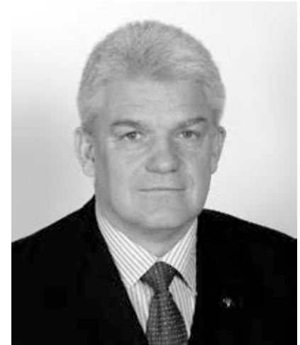
Szalay Ferenc Szolnok polgármestere

Szolnok megyei jogú város polgármestere Szalay Ferenc 1955-ben született Esztergomban. 1998-tól 2002-ig, majd 2006 óta vezeti a Tisza-parti települést. Polgármesterré választásakor nagyon sokat számított a közösség bizalma, az a légkör, mely akkor jellemezte a várost és a Fidesz szolnoki szervezetét. Úgy érezte, hogy valóban tud segíteni, s eredményesen képviselni a város és az itt élők érdekeit.