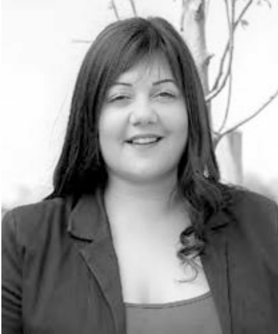
Tóth Nóra Jásztelek polgármestere

„A múltunkra alapozva, összefogással, szeretetben építeni a jövőt.”