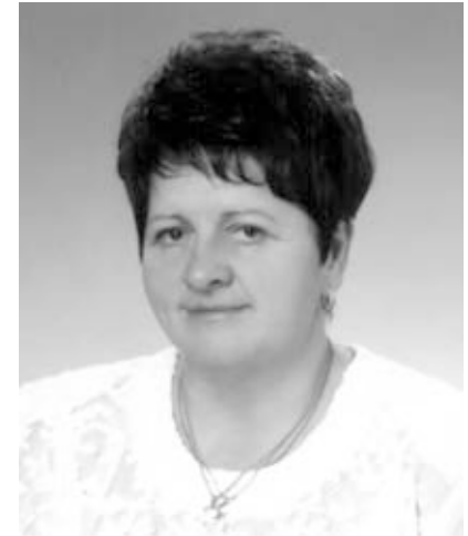
Pádár Lászlóné Kenderes polgármestere