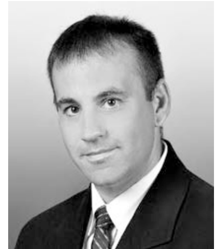
Hegyes Zoltán Cibakháza polgármestere

Cibakháza polgármestere Hegyes Zoltán 1973-ban született Kunszentmártonban. 2006 óta látja a polgármesteri teendőket Cibakházán. A közösség szolgálata mindig is elsődleges volt számára, s ezt nem csak a polgármesteri pozícióból tartotta megvalósíthatónak. 12 évvel ezelőtt alpolgármesteri tisztséget töltött be, és nem tartozott a tervei közé a polgármester választáson történő indulás. Ugyanakkor néhány hónappal a választások előtt a település polgáraitól, civil szervezetektől, vállalkozóktól és a hivatal köztisztviselőitől olyan sok felkérést kapott, amely meggyőzte arról, hogy vállalnia kell a megméretést.