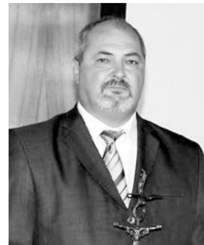
Kerekes András Tiszaszőlős polgármestere

A megválasztásom után a szó szoros értelmében egy romokban heverő település irányítását vettem át. Alig voltak járható utak, az önkormányzati épületek teljesen lepusztultak, semmilyen fejlesztés nem történt a 25 év alatt. A szociális ellátás abban merült ki, hogy 15-20 idős embernek kihordták az ebédet, amit az árokparton raktak le, mert olyan rossz állapotban volt a szociális intézmény. A többiek sem voltak jobbak, omladozott a vakolat, nem volt a közigazgatásban jártas szakember, nem volt informatikai rendszer, a high-tech korában az iroda felszereltsége egy fekete, tárcsás telefon és egy Robotron írógép volt. A hivatal épülete beázott, az irodámban volt egy lavór és egy vödör, abba csöpögött a víz, ha esett az eső. Így kezdtem a polgármesterségem. Ebből a romhalmazból kellett egy működő és életképes települést létrehozni. Elsődleges feladat az volt, hogy megfelelő szakembereket kellett találni az önkormányzati, hivatali feladatok ellátására. Tanulni kellett mindenkinek a „szakmát”, a képviselő-testületnek és jómagamnak is.