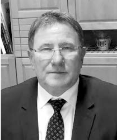
Farkas Ferenc Jászapáti polgármestere